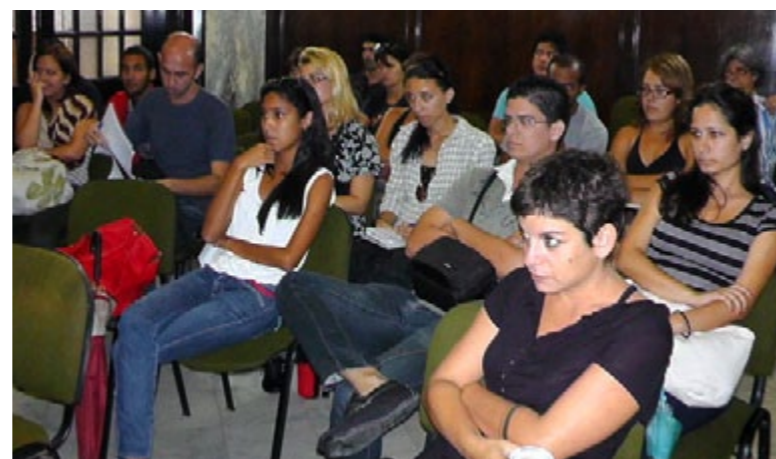
Público asistente al conversatorio