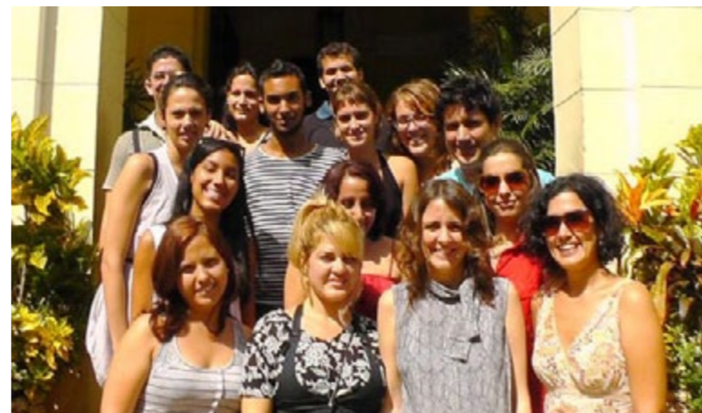
Participantes en el taller